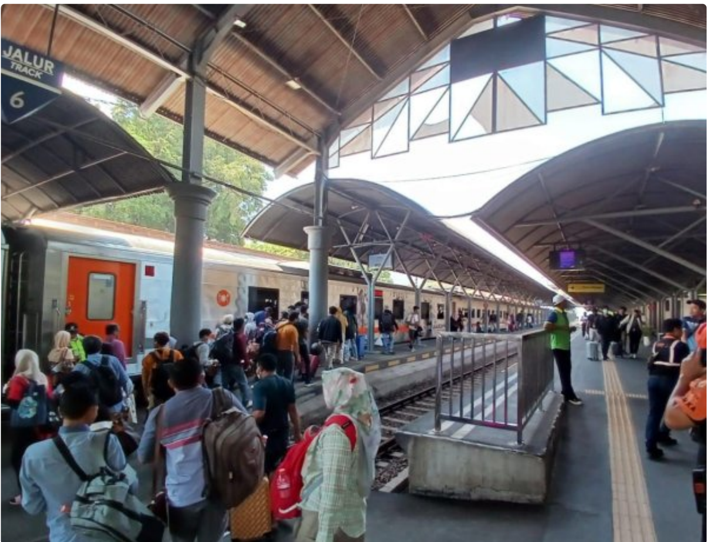
Calon penumpang kereta api

SURABAYA - Pagi ini, Rabu (18/10/2023) penumpang Kereta Api (KA) Argo Semeru yang hendak berangkat dari Stasiun Gubeng Surabaya tujuan Stasiun Jatinegara Jakarta mengalami delay. Jadwal keberangkatan yang semestinya