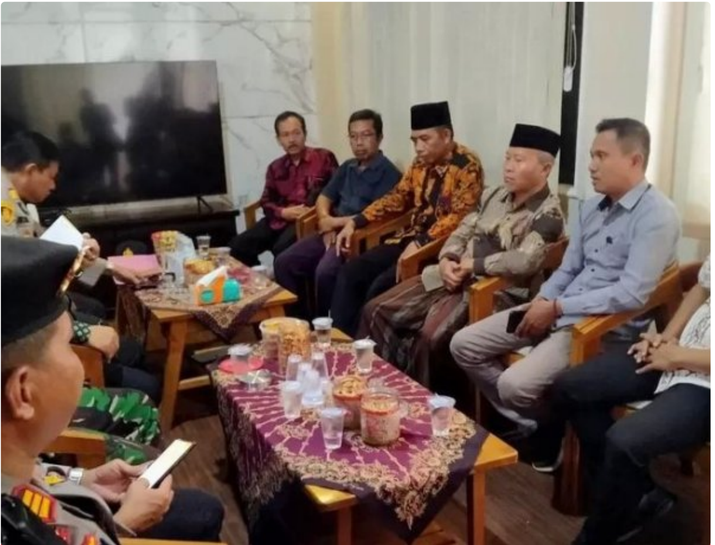
Audiensi tokoh agama yang tergabung di Aliansi Umat Islam dengan Forpimka Cluring

BANYUWANGI - Meskipun meresahkan, keberadaan toko yang menjual secara bebas minuman keras beralkohol berbagai merek yang berada di Desa Benculuk tepatnya di depan Rumah Makan Tudung Saji ini nampak aman-aman saja. Menyikapi hal tersebut, Aliansi Umat Islam Kecamatan Cluring melakukan aksi damai pencegahan maraknya peredaran minuman keras (miras) dan