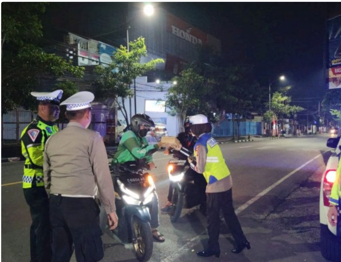
Satlantas Polres Bojonegoro membagikan makanan sahur ke pengguna jalan

BOJONEGORO - Satuan Lalu Lintas (Satlantas) Polres Bojonegoro kembali melaksanakan bakti sosial dengan membagikan makanan sahur kepada warga masyarakat yang membutuhkan, Senin (25/3/2024) dini hari.