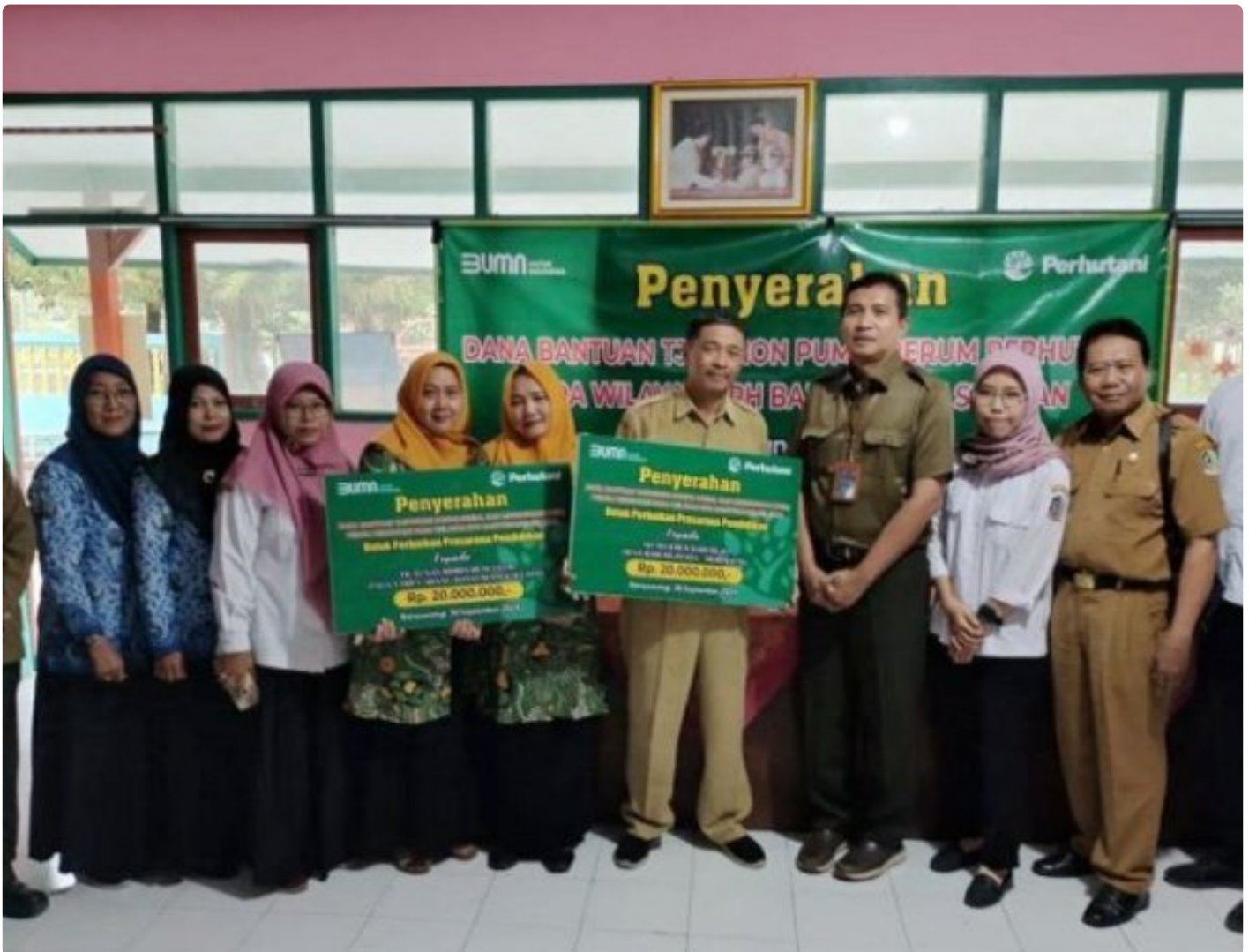
Perhutani KPH Banyuwangi Selatan menyerahkan dana bantuan TJSL sebesar Rp. 40 juta kepada dua lembaga pendidikan, Selasa (1/10/2024).

BANYUWANGI – Pendidikan merupakan pondasi utama dalam upaya mewujudkan generasi emas yang cerdas dan berkarakter. Kesadaran akan pentingnya pendidikan sebagai investasi jangka panjang untuk kemajuan suatu bangsa, menjadi dorongan utama bagi Perhutani KPH Banyuwangi Selatan untuk