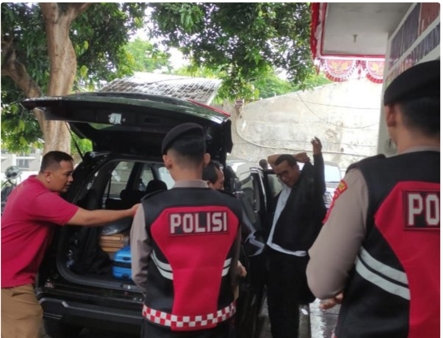
Personel Polresta Banyuwangi melakukan pengawalan ketat proses pengiriman hasil penghitungan surat suara Pilgub Jatim 2024 ke KPU Jatim

BANYUWANGI – Polresta Banyuwangi memberikan pengawalan ketat proses pengiriman hasil penghitungan surat suara Pilgub Jatim 2024 dari Kantor KPU