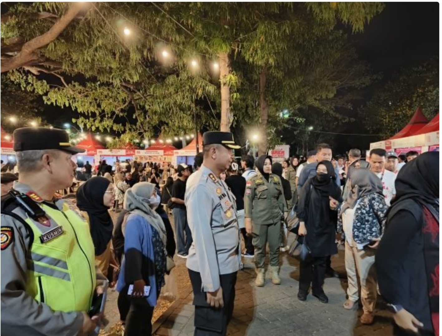
Pengamanan festival musik tepi pantai oleh anggota Polresta Banyuwangi, Senin malam (16/9/2024).

BANYUWANGI - Kepolisian Resor Kota (Polresta) Banyuwangi menggelar pengamanan Festival Musik Tepi Pantai yang digelar oleh Bank Jatim di pantai Boom Marina, Senin (16/9/2024) malam. Apel pengamanan dipimpin langsung